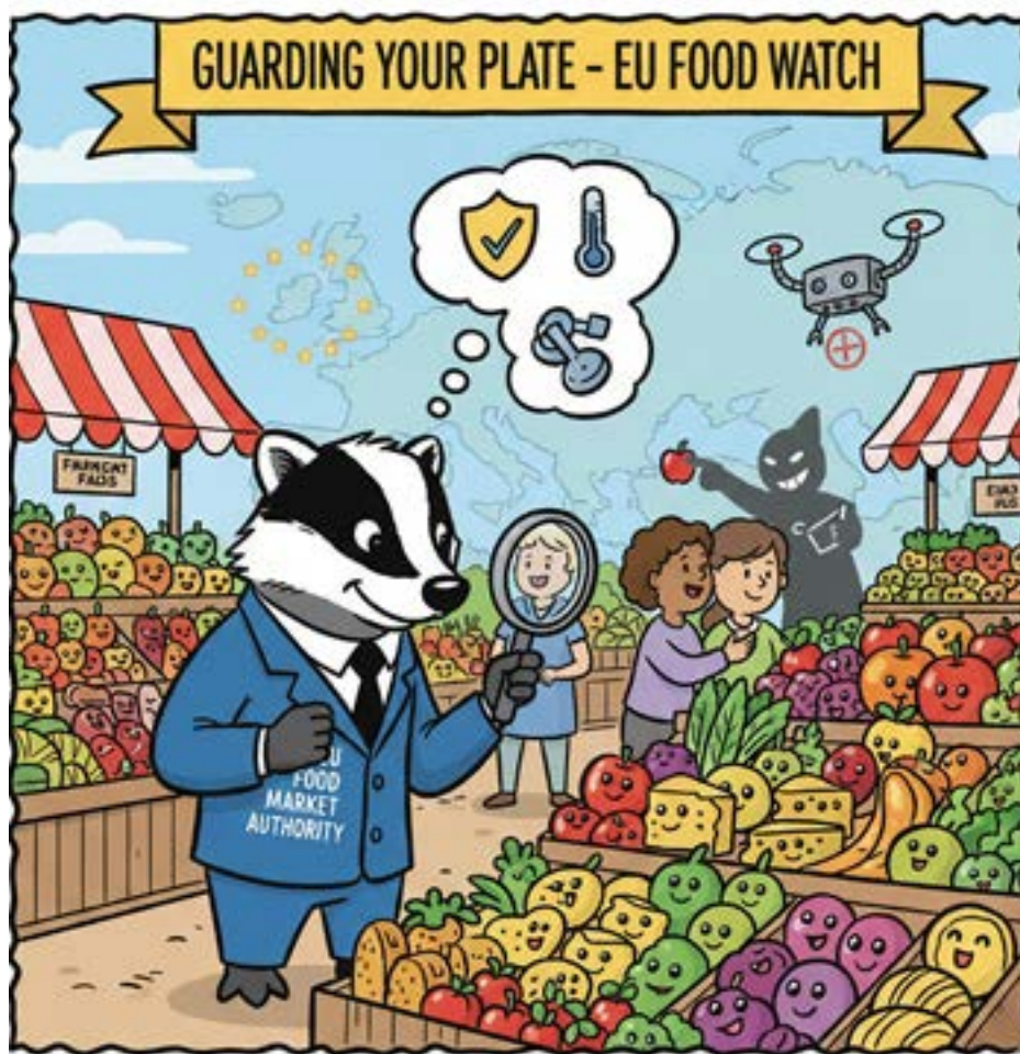
La sorveglianza del mercato nell'Unione Europea By Gemini (*)

È la prova che l'Europa non si limita a legiferare, ma applica, coordina e interviene. La sorveglianza del mercato è uno degli esempi più concreti di integrazione europea riuscita: poco visibile, altamente tecnica, ma decisiva per la vita quotidiana dei cittadini e per la competitività delle imprese. Un'Europa che funziona, spesso lontano dai riflettori, ma esattamente dove conta di più. (*)