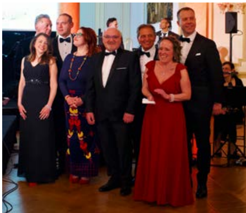
Cena di gala

BRUXELLES – La settima edizione del Grand Bal d'Italie, tenutasi il 24 gennaio 2026 presso il prestigioso Cercle Royal Gaulois, ha riscosso un grande successo di pubblico, confermandosi come uno degli appuntamenti culturali e mondani più attesi della comunità italiana e internazionale a Bruxelles.