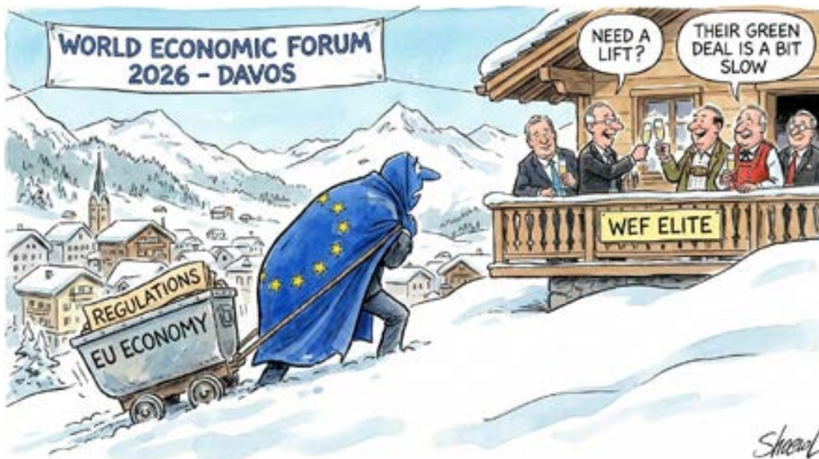
World Economic Forum di Davos

La notizia più dirompente del gennaio 2026 è il rinnovato e aggressivo tentativo di Donald Trump di acquisire la Groenlandia . Quella che nel 2019 era parsa una proposta estemporanea si è trasformata in una priorità di sicurezza nazionale per Washington, legata al controllo delle rotte artiche e delle riserve di terre rare, essenziali per la competizione tecnologica con la Cina. Lo scorso 17 gennaio, l'amministrazione Trump ha annunciato l'imposizione di dazi del 10% su otto paesi europei