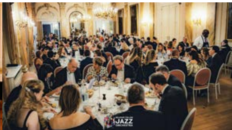
Cena di gala

dell'Ambasciata d'Italia in Belgio, del Consolato Generale d'Italia a Bruxelles, dell'Istituto Italiano di Cultura di Bruxelles e del Comune di Napoli, il Grand Bal d'Italie ha riunito oltre 350 persone tra rappresentanti delle istituzioni italiane e locali, del mondo diplomatico, culturale e associativo, insieme a numerosi ospiti, rafforzando il ruolo dell'evento come spazio di incontro e dialogo tra Italia e Belgio. Pulcinella, figura emblematica della tradizione popolare, nel ruolo di cerimoniere, ha accompagnato il pubblico nei diversi momenti della serata: dalle performance ispirate alla cultura partenopea della Belgian Italian Jazz Orchestra, del coro Belcanto e del gruppo folkloristico TerraNostra, fino alla cena di gala