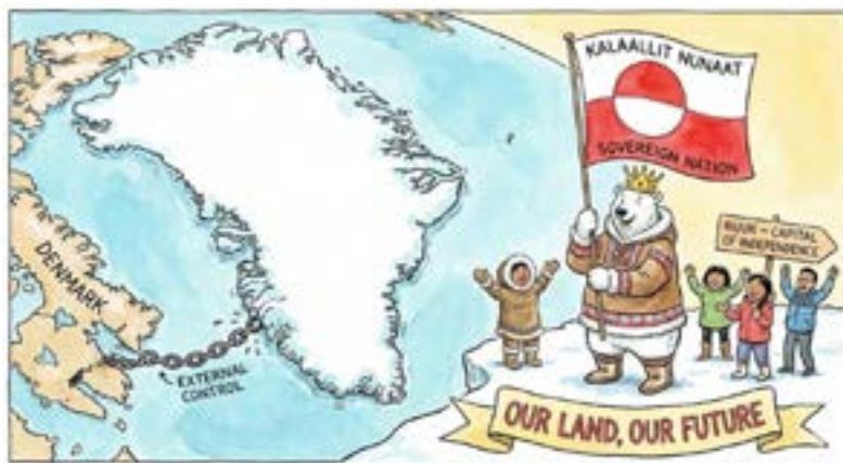
Groenlandia sovrana by Gemini (*)

L'impatto economico delle politiche di Trump nel gennaio 2026 è immediato e strutturale. Sebbene nell'estate del 2025 fosse stata raggiunta