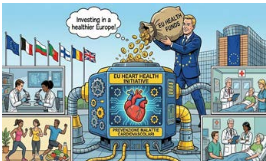
Investimenti UE per la prevenzione delle malattie By Gemini (#)

Ad esempio, la Commissione sosterrà gli Stati membri nello sviluppo di piani nazionali per la salute cardiovascolare, nell'istituzione di dashboard per il monitoraggio delle disuguaglianze sanitarie e nel lancio di un incubatore per accelerare l'uso dell'intelligenza artificiale. Oltre ai benefici per la salute pubblica, il Piano Safe Hearts si propone anche di rafforzare l'economia dell'UE e stimolare l'innovazione nell'assistenza cardiovascolare, con obiettivi chiari fissati per il 2035. (*)