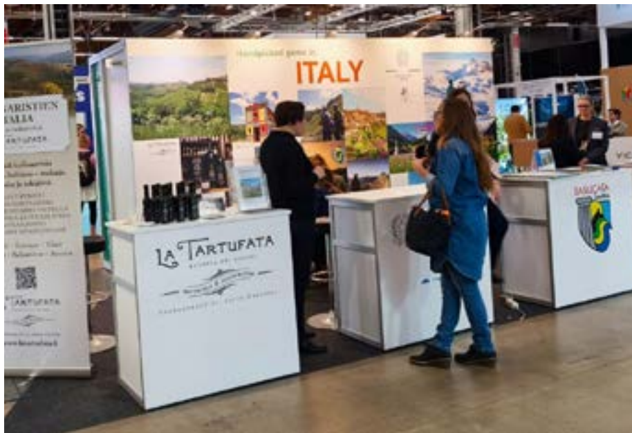
Lo stand italiano della 38ª edizione a Matka

L'evento continua a esercitare un forte richiamo