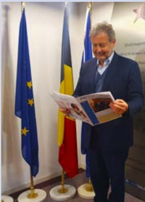
PiùEuropei a Bruxelles (#)

Le norme rigorose dell'UE in materia di salute e sicurezza alimentare