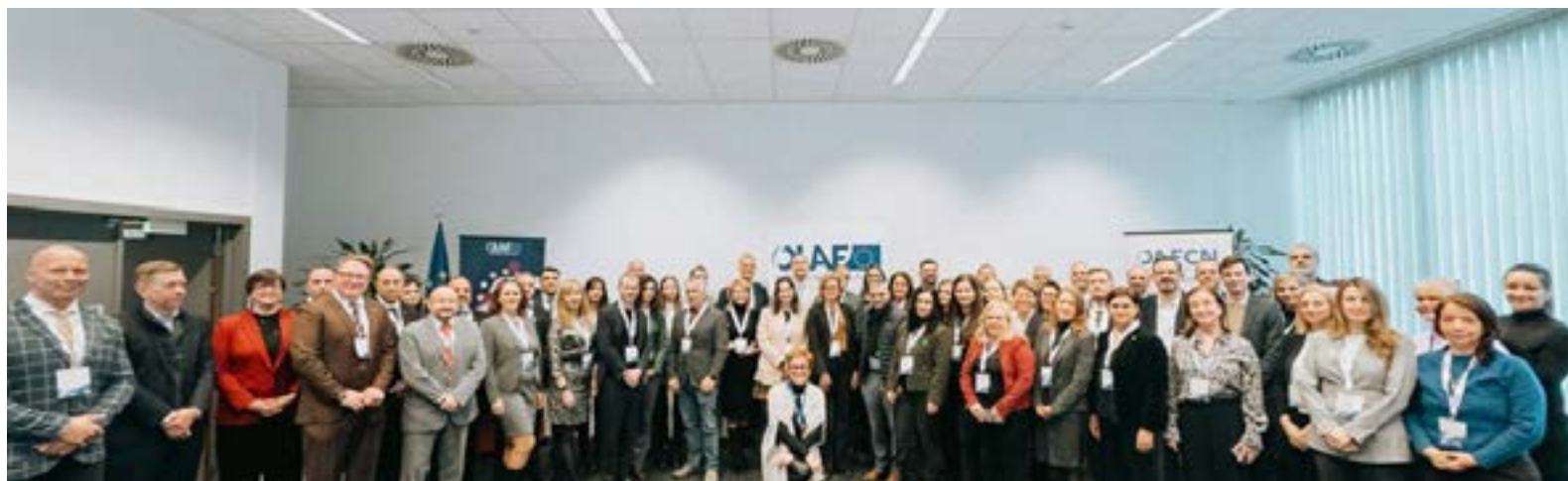
OAFCN meeting on 27-28 January 2026, Brussels (*)

L'incontro ha confermato ancora una volta che l'OAFCN rimane un importante forum di cooperazione, aiutando i comunicatori di tutta l'UE a parlare con chiarezza, credibilità e impatto sulla lotta contro le frodi. (*)