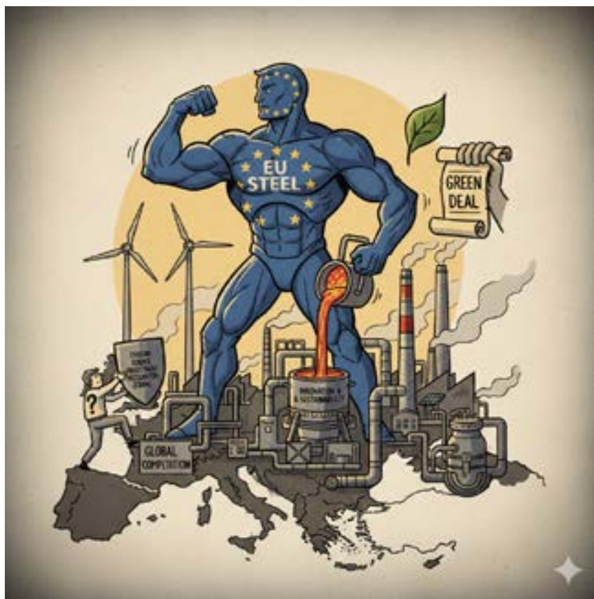
Industria siderurgica europea By Gemini (*)

Con l'adozione del testo in plenaria, il Parlamento ha definito una posizione negoziale solida in vista dei triloghi con il Consiglio, che ha già adottato la propria posizione in prima lettura nel dicembre 2025. L'obiettivo condiviso è chiaro: evitare un vuoto regolatorio dal 1° luglio 2026 e garantire una protezione coerente e continuativa a uno dei settori chiave dell'economia europea. (*)