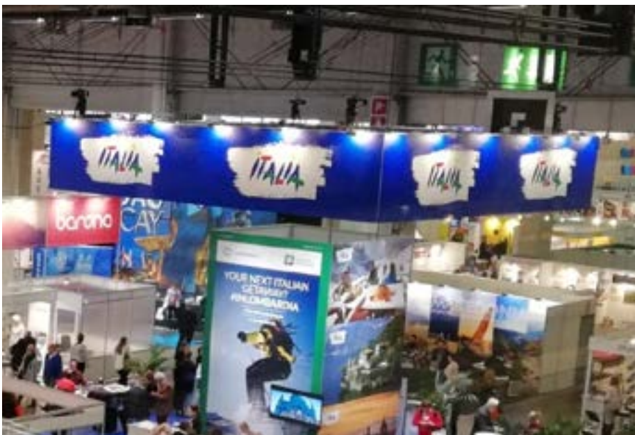
Il padiglione Italia alla Matka di una edizione passata

sugli espositori internazionali. Molte destinazioni hanno ampliato la propria presenza con programmi più ricchi e nuovi prodotti, e diversi paesi hanno incrementato il numero di aziende rappresentate. È stato infatti dimostrato come la visibilità all'interno della fiera stimoli l'interesse verso tali mete. Parallelamente, cresce l'attenzione verso il turismo interno. Tra le regioni finlandesi presenti in numero record, la cooperazione e la promozione congiunta hanno giocato un ruolo chiave.