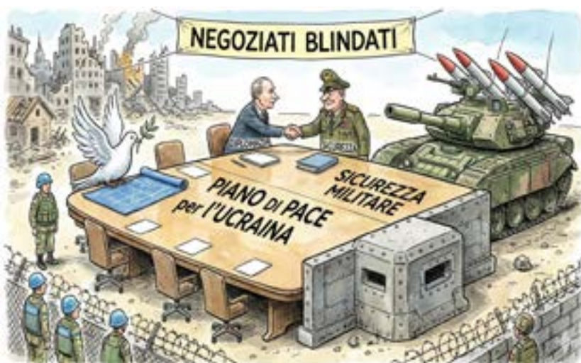
Piano di Pace per l'Ucraina e la Sicurezza Militare by Gemini (*)

pre più bloccate o inefficaci nel gestire tale turbolenza. Sebbene questo rapporto esamini gli scenari peggiori in tutti i settori, è anche chiaro che nuove forme di cooperazione globale si stanno già sviluppando anche in un contesto di concorrenza, e l'economia globale sta comunque dimostrando resilienza di fronte all'incertezza. La sfida per i prossimi mesi sarà duplice: da un lato, gestire la crisi economica derivante dai dazi senza innescare una depressione; dall'altro, costruire in tempi rapidissimi una capacità militare e diplomatica autonoma. Senza un'integrazione fiscale e capacità difensiva, l'Europa rischia di diventare un "osservatore passivo" del proprio destino, schiacciata tra gli interessi di Washington e le ambizioni di Mosca e Pechino. L'incertezza regna sovrana e il vertice di Davos di gennaio 2026 ha confermato che il multilateralismo, come lo conoscevamo, è stato sostituito da una "grande instabilità" dove la forza economica è usata come arma diplomatica primaria. (*)