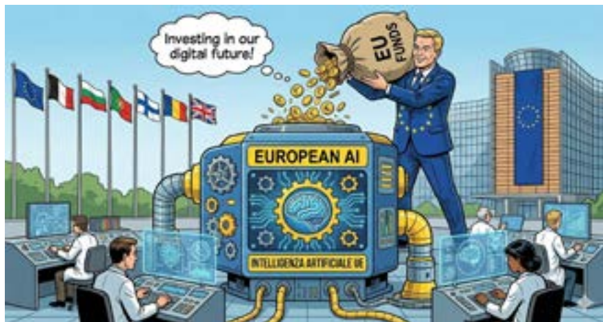
Investimenti UE per l'AI

per gli utenti finali e di componenti delle tecnologie di base, a sostegno dei beni comuni digitali sovrani europei. Il secondo bando, con uno stanziamento di 85,5 milioni è volto, invece, a promuovere l'autonomia strategica aperta nelle tecnologie digitali ed emergenti e nelle materie prime correlate. Questo bando si concentrerà su ambiti quali gli agenti di IA di prossima generazione, la robotica per applicazioni industriali e di servizio e lo sviluppo di nuovi materiali con capacità di rilevamento avanzate. Nel loro insieme, questa decisione punta a promuovere un'innovazione sostenibile e a rafforzare la leadership europea nelle tecnologie digitali strategiche, in linea con la bussola per la competitività della Commissione. Attraverso questo investimento, l'esecutivo europeo