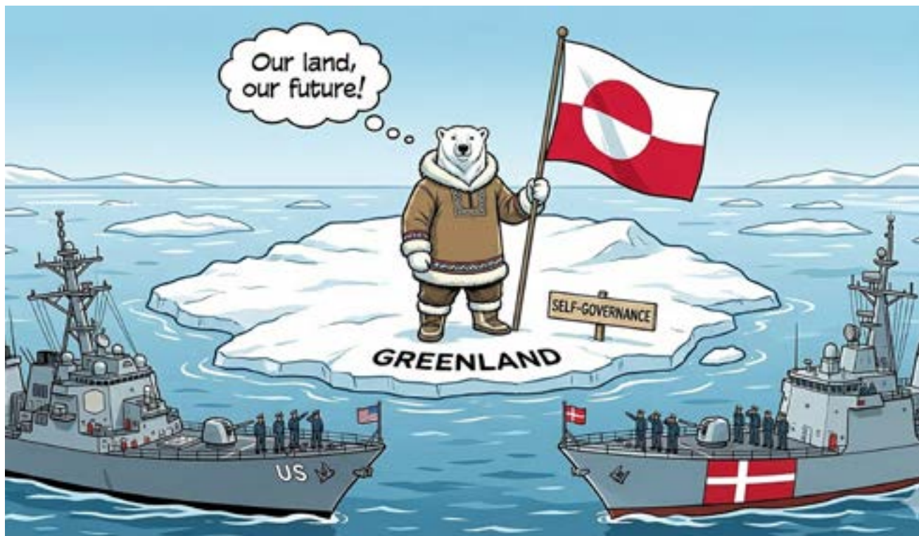
By Gemini - La sovranità della Groenlandia (#)

Nonostante ciò Trump, fermo nel suo intento predatorio, ha alzato il livello dello scontro con l'Europa sempre sulla Groenlandia con ulte-