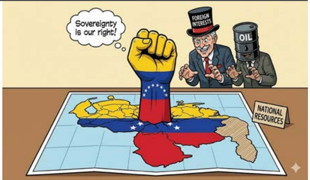
By Gemini - La sovranità del Venezuela (#)

A tal proposito non può condividersi il ripetuto assunto che l'Europa non abbia i mezzi per farsi valere di fron-