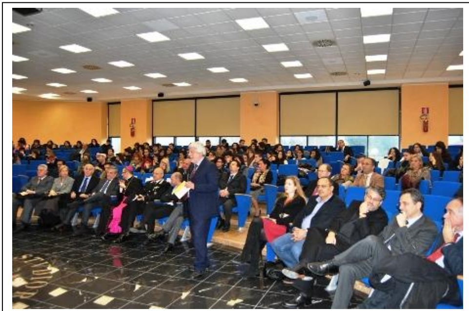
Galleria fotografica con le motivazioni del Premio Argil 2011