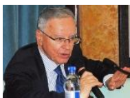
di Gino Falleri.